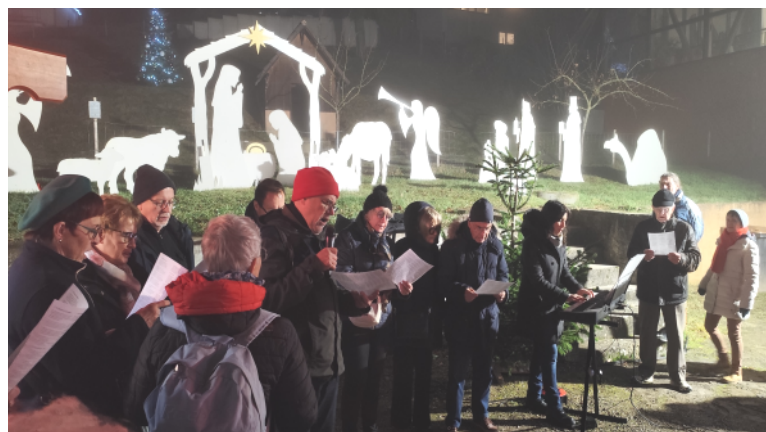
Les chants de Noël pendant le marché de la St Nicolas.