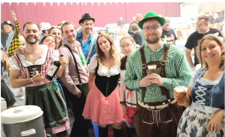
Oktober' Flax : moment festif et joyeux.