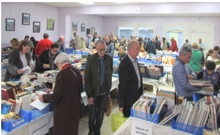
La Bourse aux Livres a connu un grand succès avec plus de 570 visiteurs.