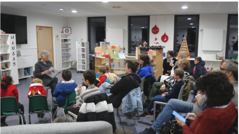
Les contes enchantés par la Bibliothèque municipale.