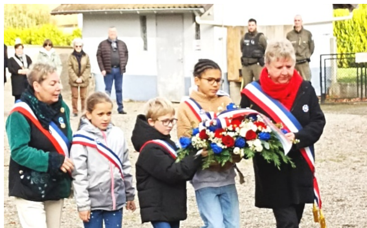
Le 11 novembre : moment de recueillement et du souvenir avec le conseil municipal des enfants.