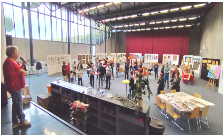
Artiflax est devenu un évènement incontournable de notre village pour mettre en avant nos artistes.