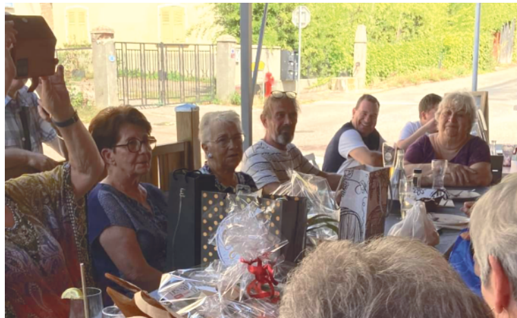
Les repas et cafés des seniors continuent chez Chriss.