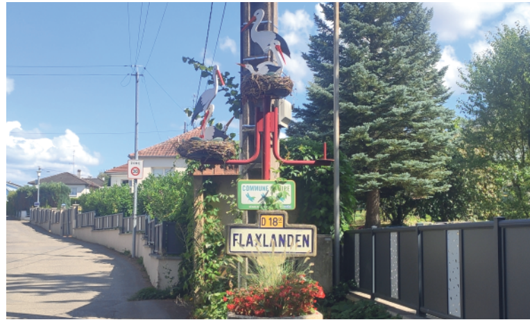
Les cigognes sont de retour grâce à la commission embellissement du village.