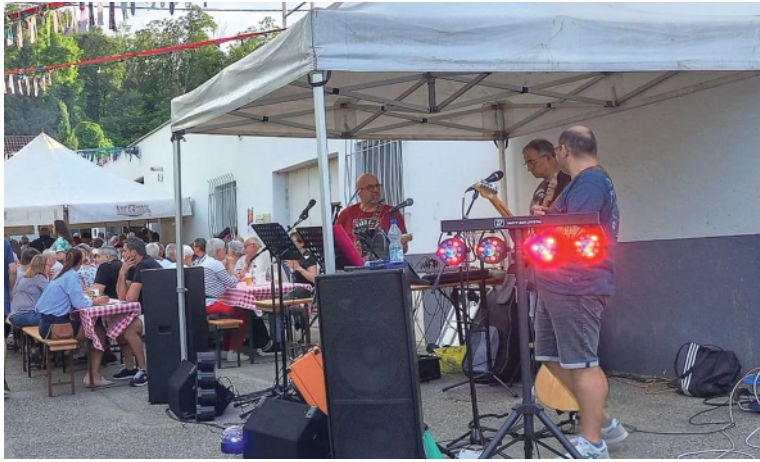
La guinguette des sapeurs pompiers, une belle soirée sous le signe de la musique.