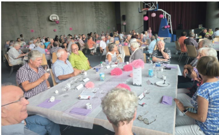
Le barbecue des anciens, un succès malgré la pluie.