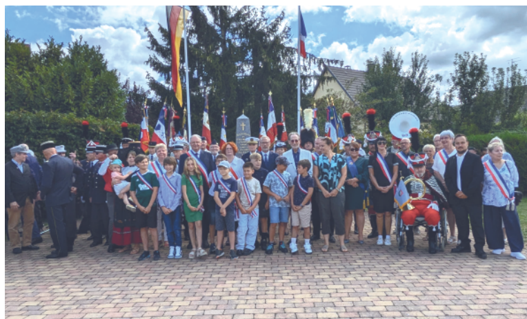
Cérémonie du souvenir de la Bataille du 19 août 1914.