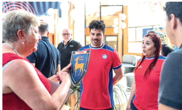
Accueil des athlètes paralympiques du Chili et remise du blason de notre village par Mme la Maire.